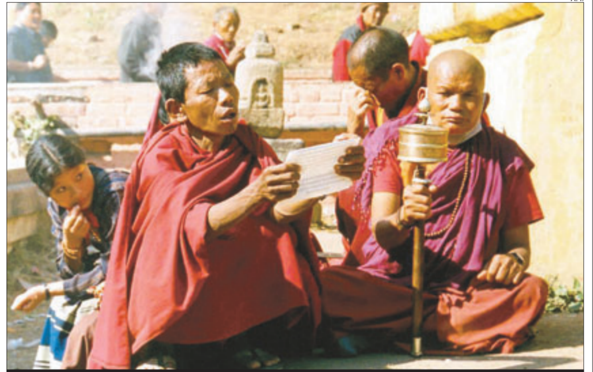
Monjes budistas en el Tibet en una imagen reciente

Por sus ojos desfilan, además, una serie de personajes que no pretenden ser modelos ilustrados de la vida en monasterio budista, pero que sí tratan de acer-