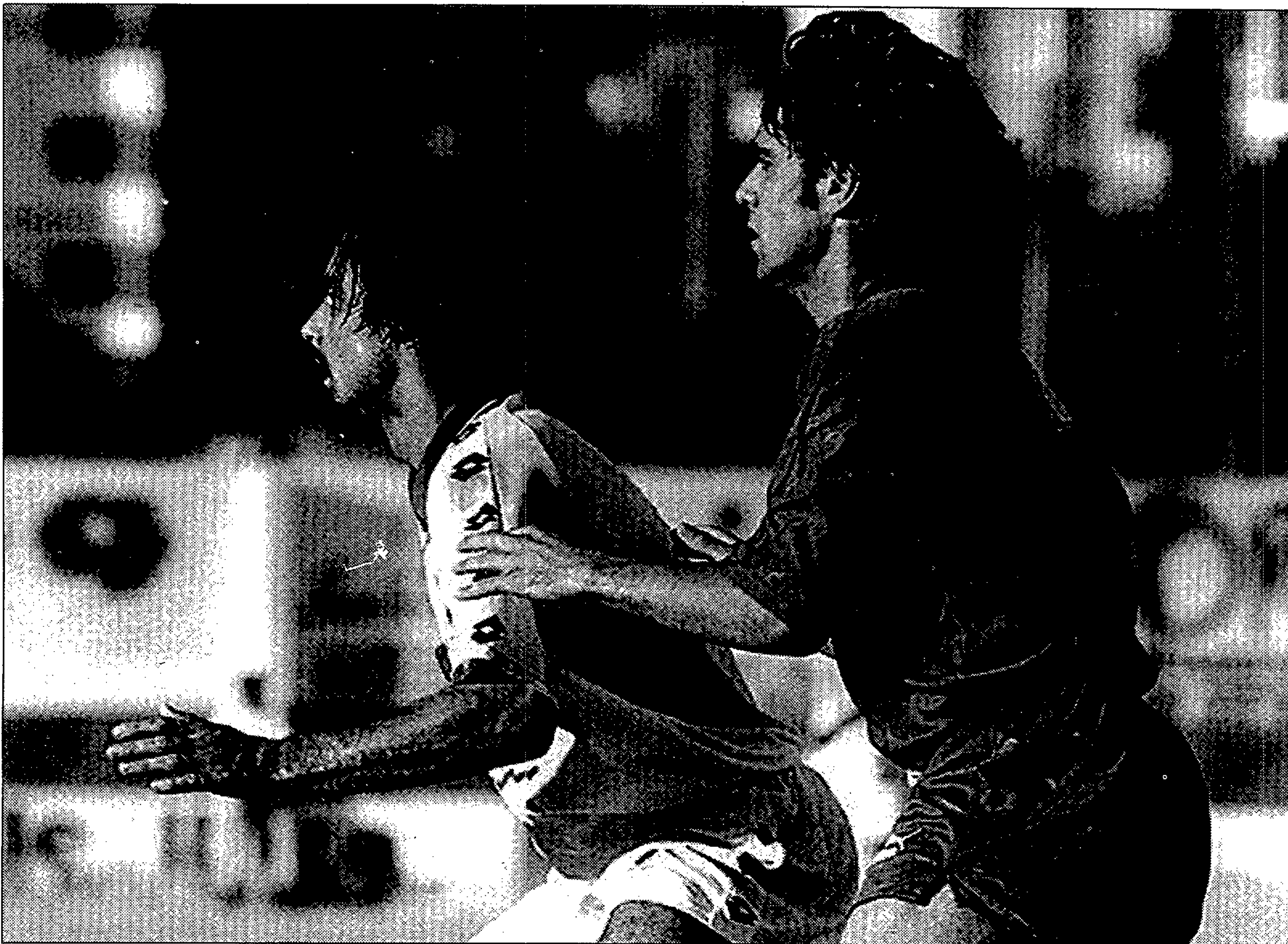
El Elche consiguió vencer al Santa Eulalia en un partido donde los goles ilicitanos fueron obra de Mir y Llorens